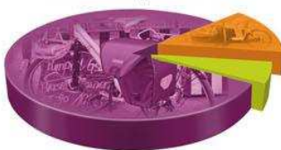
Jak se nákup dal odvézt

■ kolo s košíkem nebo brašnou 80 % ■ nákladní vozík za kolo 14 % ■ automobil 6 %